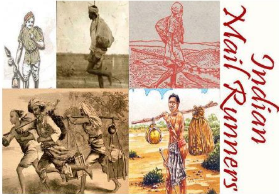
प्राचीन ते मध्ययुगीन काळात डाक तथा पत्र पोहोच करणारे धावपटू

उपलब्ध माहिती नुसार प्राचीन काळात राज्यकर्ते, सामंत, मंडलिक, मोठ मोठे जमीनदार यांनी त्यांच्या त्यांच्या प्रदेशात काय काय चालत आहे. याचे प्रत्येक क्षणाचे बित्त बातमी समजून घेणेसाठी त्यांनी त्यांचे संदेश पोहोच करणेसाठी आणि स्वीकार करणेसाठी स्वतंत्र यंत्रणा उभी केली होती. त्यांनी त्या संदेश वाहकांना संदेश स्वीकारणे आणि पोहोच करणे बाबत प्रशिक्षण दिलेले असायचे त्यामुळे पत्रव्यवहार करणे सोपे होत होते. मानवी संदेश वाहक व्यतिरिक्त प्राचीन काळात कबुतरांचा वापर संदेश वहन किंवा पत्रव्यवहार करणेसाठी करत होते. याकरिता कबुतरांनाही प्रशिक्षण दिले जात असल्याचे दिसून येते. याशिवाय संदेश वाहक आपले कर्तव्य प्रामाणिकपणे पार पाडत होते किंवा नाही यासाठी त्यांच्यावर देखरेख करणेसाठी स्वतंत्र गुप्तहेरची व्यवस्था केलेली होती. १