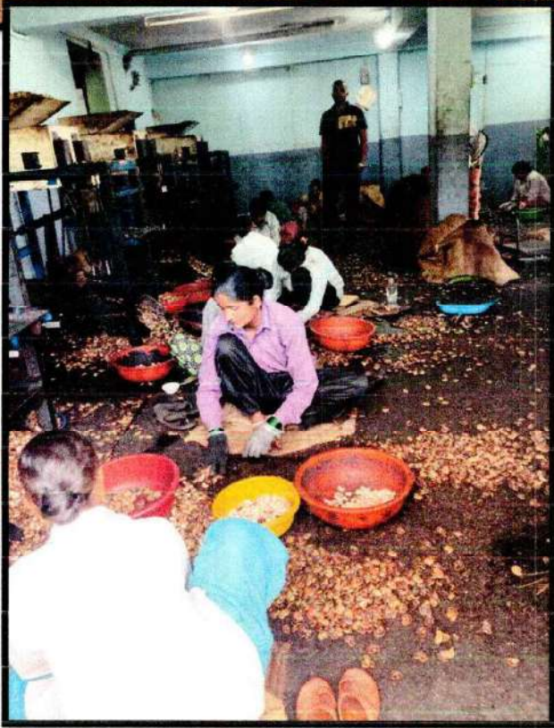
Ganesh cashew industries (Chandgad)