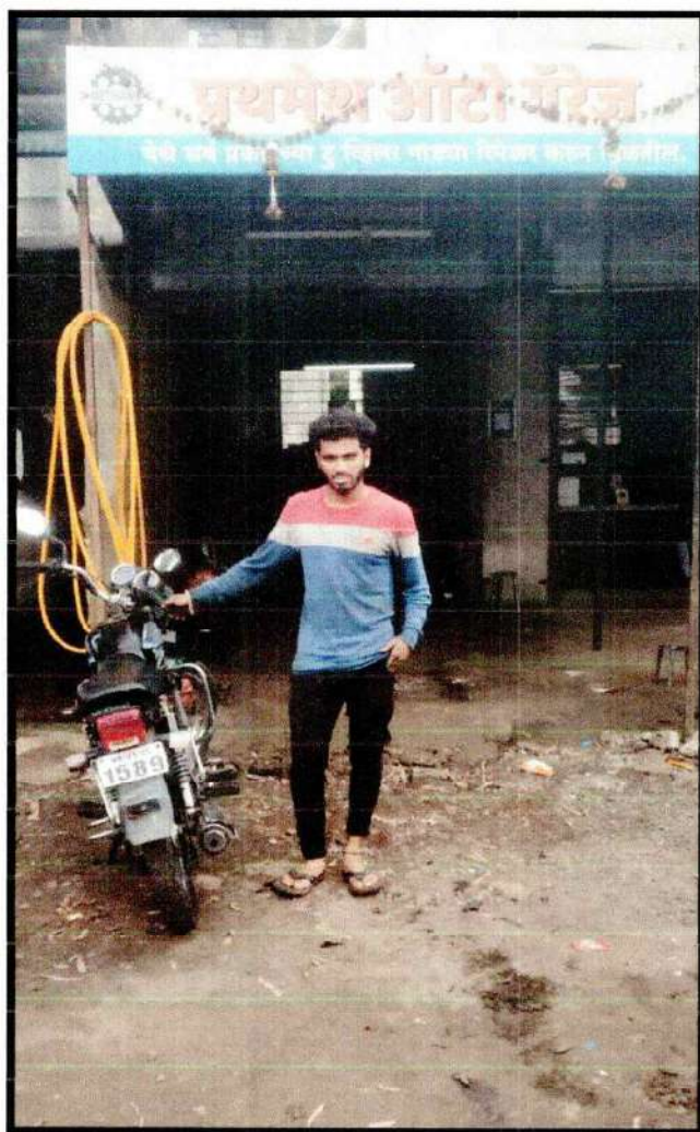
Prathamesh Auto Garage (Kolhapur)