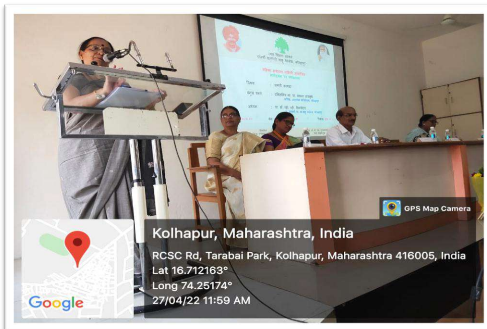
Inauguration of Inter-zonal Swimming Competitions- Chief Guest Hon. Mr. Vikrant Patil

Kolhapur, Maharashtra, India P67X+GXR, Tarabai Park, Kolhapur, Maharashtra 416005, India 02/12/22 10:47 AM GMT +05:30