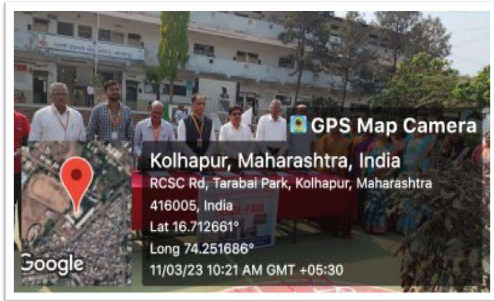
Hon. Dr. M. B. Shaikh - Inauguration of Trade Fair--Date: 11/03/2023