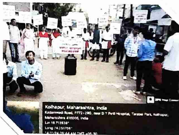
N. S. S. Volunteers performing Street Play at Sadar Bajar