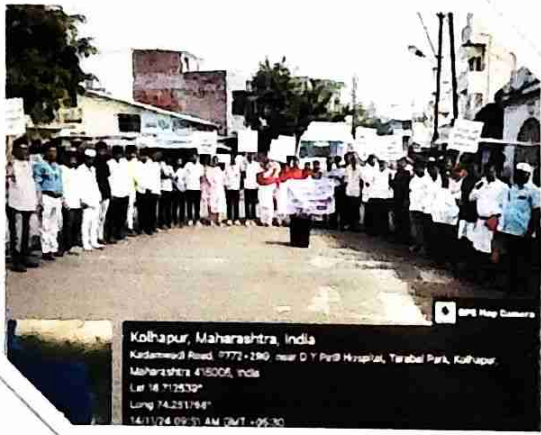
Participants of Street Play and Voter's Awareness Street play Squad